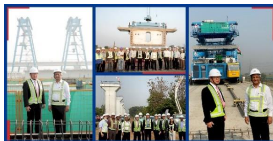
日本からの工事視察団

★★★★★★★★★★★★★★★★★★★★★★★★★★★★★★★★★★★★★★★★★★★★★★★★★★★★★★★★★★★★