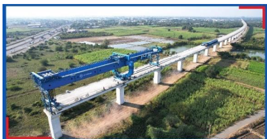
高速鉄道建設工事の様子

インドはこれから、情報だけが瞬時に動く時代から、人も物も、お金も、そして人の心も動く時代を迎えようとしています。