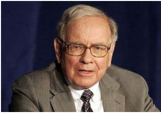
ウォーレン・バフェット